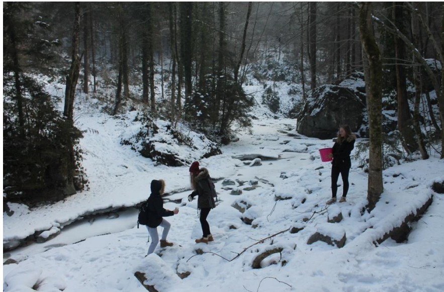
Slika 8: Prenašanje vode iz potoka

Navodilo: člani skupine morajo z eno posodico, ki ima na dnu luknjo, napolniti veliko vedro z vodo iz potoka. Posoda je od potoka odmaknjena 10 m. Člani skupine se morajo zato sami znati organizirati tako, da svojo posodo čim prej napolnijo z vodo. Obenem se meri čas.