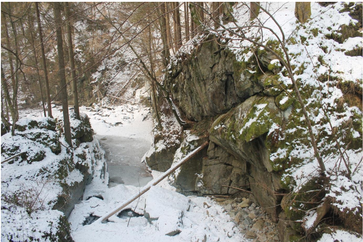
Slika 2: Ribiški raj

Med potjo smo opazili tudi ostanke znanega Flosarjevega mlina. Pot nas popelje vse do ribiškega raja, kjer so tudi ostanki 'Krivčeve žage'. Ribiški raj se imenuje zato, ker je potok Oplotniščica včasih gostila ogromne količine rib. Ob poti so zgradili tudi klopce in mizice, kjer si lahko oddahnemo in prisluhnemo naravi.