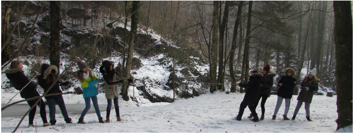
Slika 9: Vlečenje vrvi

Navodilo: Skupine tekmujejo med seboj v vlečenju vrvi.