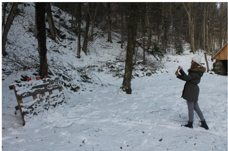
Slika 6: Streljanje s fračo v pločevinke

Navodilo: vsi člani skupine se razvrstijo pred strelišče. Vsak dobi fračo in kup kamenčkov. Ko vodja iger da znak, pričnejo s streljanjem kamenčkov v tarče (15 pločevink). Tarče so od strelišča odmaknjene 5 m. To počnejo tako dolgo, da vsi člani skupine poderejo vse pločevinke. Obenem se meri čas.