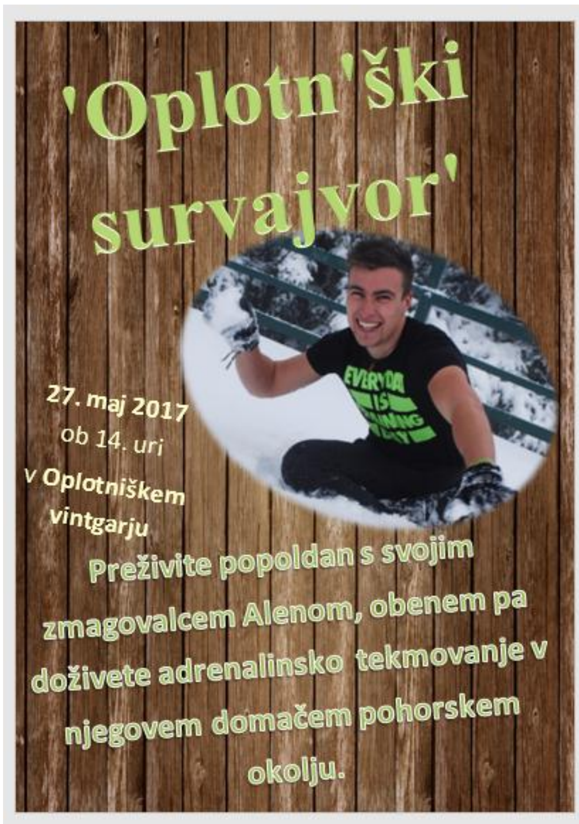
Slika 12: Primer letaka