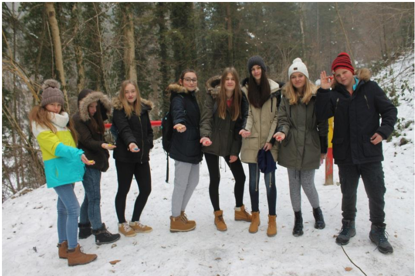
Slika 5: Izbiranje kamenčkov in razdelitev v skupine

Navodilo: vsak izmed udeležencev vleče iz vreče kamenček. Glede na barvo kamna se oblikujejo skupine. Kdo bo v kateri skupini, bomo določili z barvo rutice, ki jo bo nosil ves čas dogajanja.