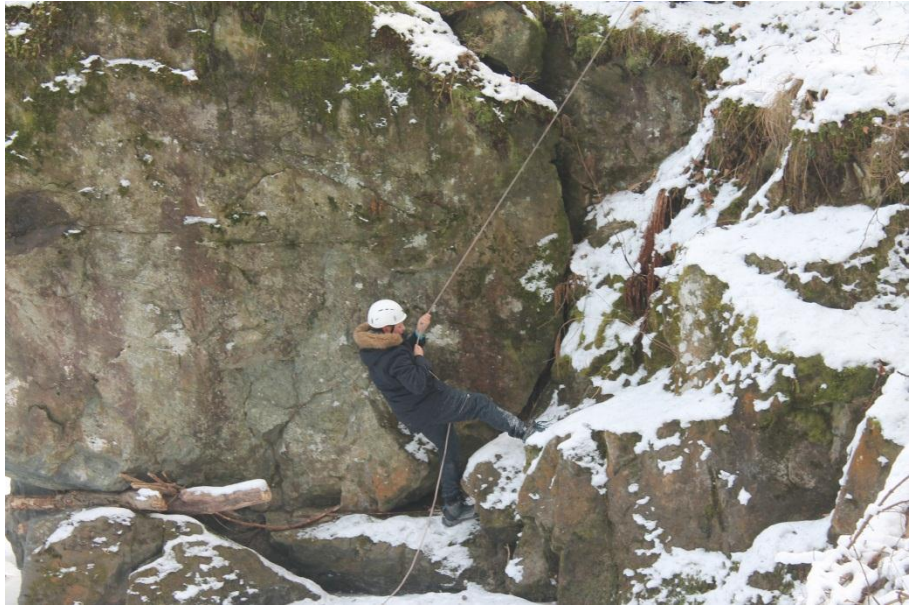
Slika 7: Plezanje

Navodilo: vsi člani skupine morajo preplezati skoraj navpično kamnito steno v Oplotniškem vintgarju. Pri tem imajo podporo gorskega vodnika, ki jim pomaga z opremo in z navodili. Tekmovalci si lahko pomagajo (spodbujanje, fizična pomoč ...). Obenem se meri čas.