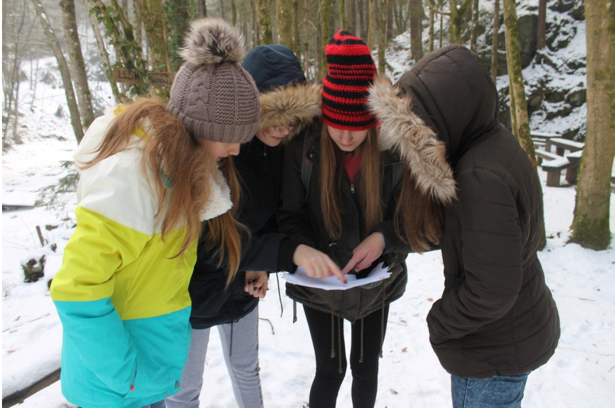
Slika 11: Iskanje skritega zaklada

Navodilo: vsaka skupina dobi svoj listek z navodili za iskanje skritega zaklada. Navodila se ločijo po barvah. Igra se konča, ko vse skupine najdejo svoj zaklad.