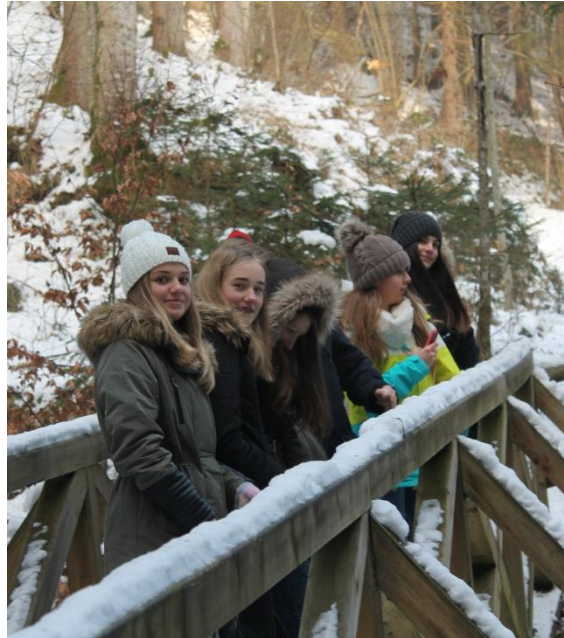
Slika 3: Most čez potok Oplotniščica

Nato smo pot nadaljevali in prečkali nov most oziroma brv, ki vintgar povezuje z drugo stranjo hriba. Pot nas popelje do Doline miru. Še pred spustom lahko ob ograji opazujemo lepoto in čudeže narave, ki jih je ustvaril potok. Le-ta je bil namreč včasih hudournik.