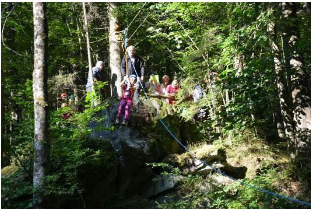
Slika 10: Spust po jekleni žici

Navodilo: vsi člani vseh skupin se spustijo po jekleni žici. Pri izvajanju pomagajo člani Planinskega društva Oplotnica.