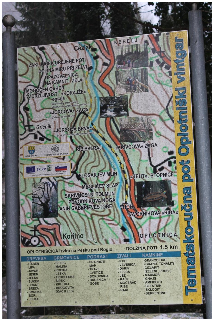
Slika 1: Zemljevid Tematsko-učne poti Oplotniški vintgar

Zagnani člani oplotniškega Turističnega društva so uredili pot s pomočjo Občine Oplotnica, Ministrstva za kmetijstvo in s pomočjo denarja, ki so ga dobili iz Evropske unije. Zdaj se lahko obiskovalci varno sprehodijo po soteski in občudujejo naravne lepote, kot so slapovi, brzice, tolmeni in ogromne obrušene skale. Med potjo spoznavajo kamnine, živali in rastline,